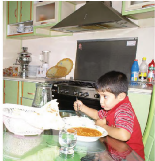
آكل بيدي اليمنى