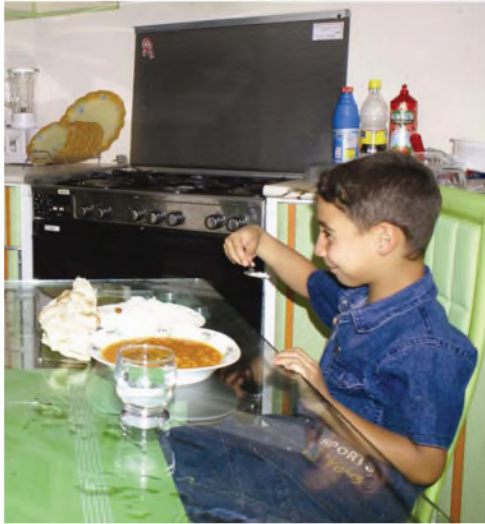
اتناول الطعام الذي أمامي