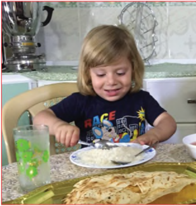
أقول قبل البدء: بسم الله