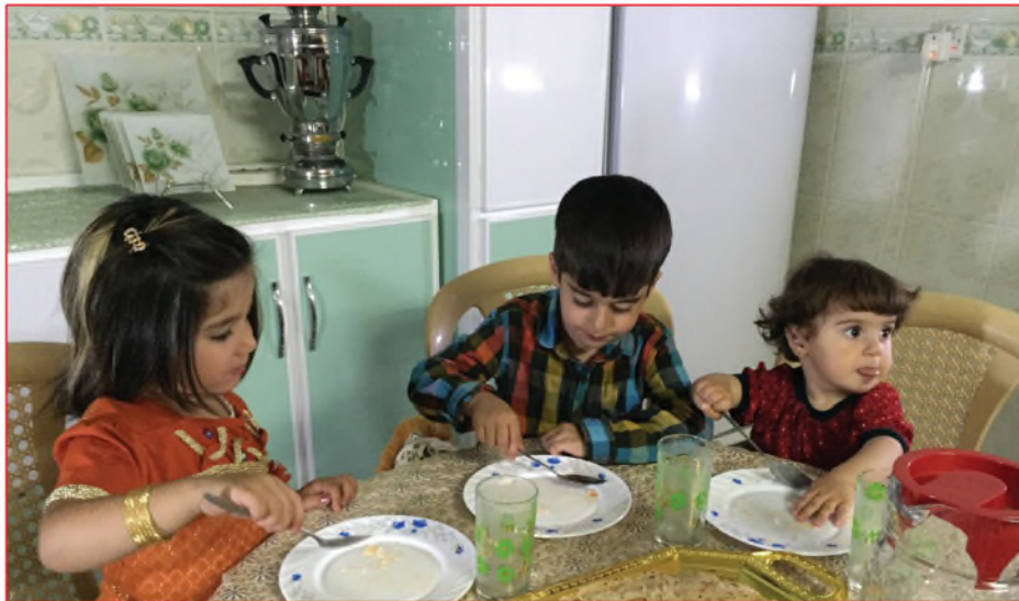
لا أبقى من الطعام شيئاً في صحنى