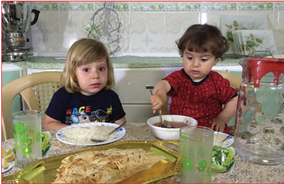
لا أنفخ على الطعام الحار، بل انتظر قليلاً حتى يبرد