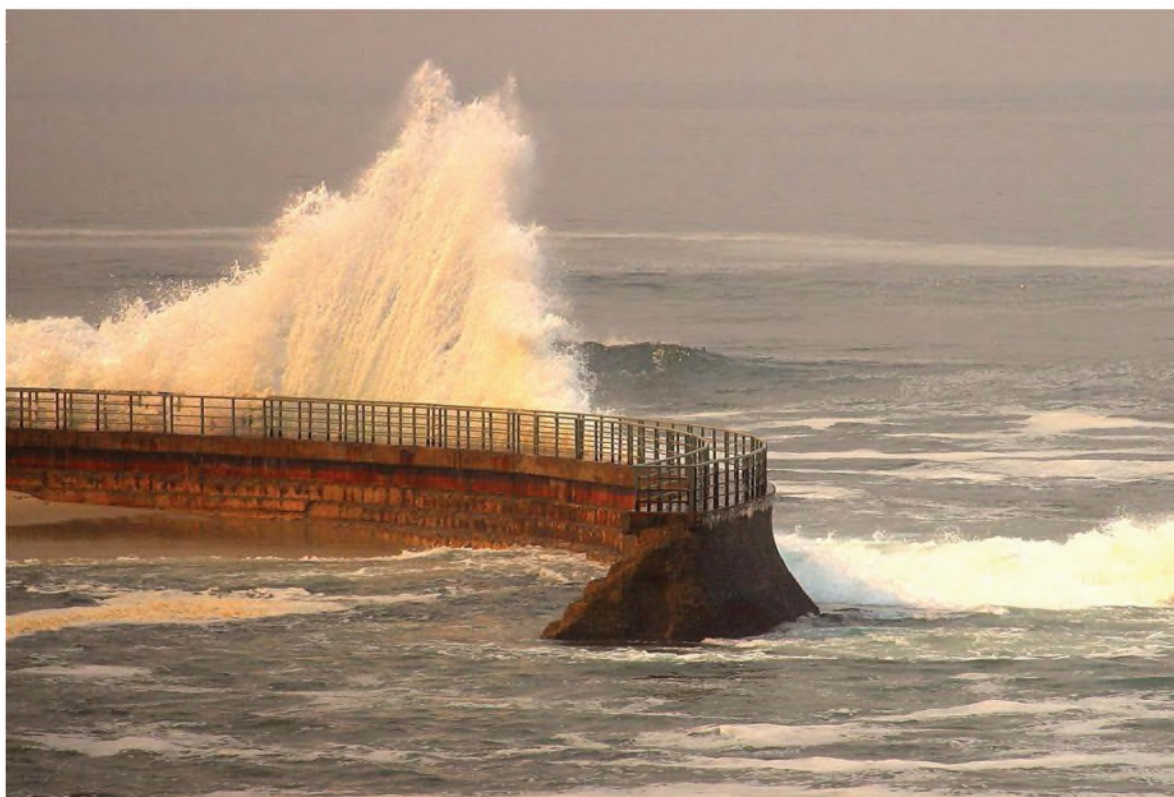
الماء و كل شيء