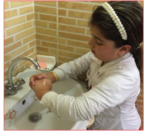
أغسل يديّ قبل الأكل