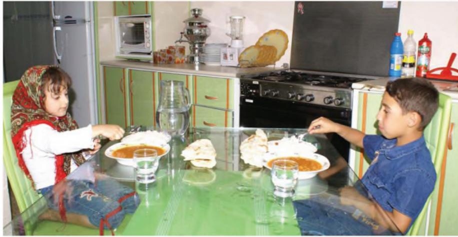
أمضغ الطعام جيداً وبدون اصدار صوت