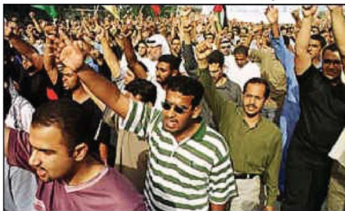
نمونهى خۆپىشانىدانىك كە توندو تىزىي تىدا بەكار ھاتوۋە

خۆپىشانىدان مافىكى سىياسىيەنى مرقۇ، بۆ دەرپرېنى ناپەزايى يان ھاتنەدى مەبەستىك، كۆمەللىك يان چەند كۆمەللىك بەكار دەھېنرى... بەلام كە بۆ ناپەزايىيى، پىۋىستە پىشتەر چەند ھەوللىك بۆ چارەسەرى كىشەكە درابىۋ ھەموو رىگە ياساىيەكان گىرابنەبەرو سوودى نەبووبى، كە ھىچ رىگەيەك نەما، پاشان پەنا بۆ خۆپىشانىدان بېرى.