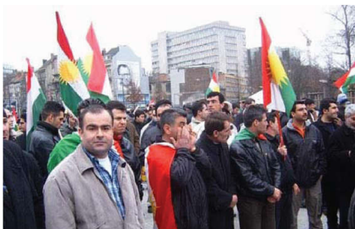
نمونهى خۆپىشانىدانى ھېمانە

يەككە لەمافە مەدەنىيەتسىيەكانى مرقۇ، دەرپرېنى ناپەزايى يان خۆشپىيە. ناپەزايى يان خۆشى بەچەند شىۋازىك دەرەبىرېرىن، يەككىيان خۆپىشانىدانە..