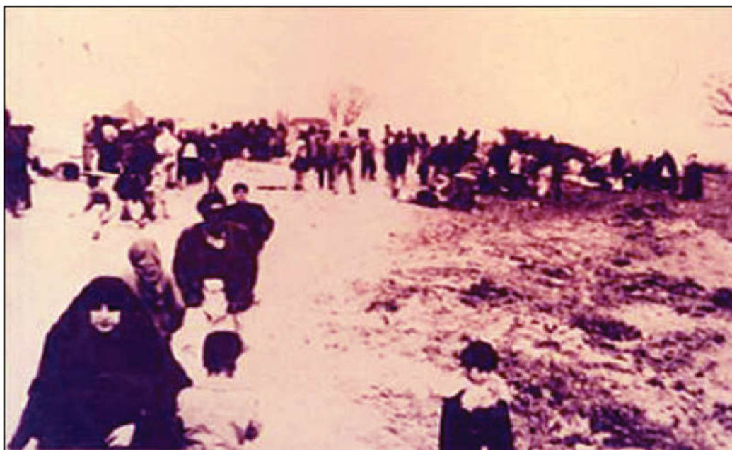
ده رکردنی کورده فه یلییه کان بو سنوره کانی ئیران (ده روزه ی منزریه)

له نیوان (۱۸ - ۲۸) سالدا بوو، وهك ده سبه سهر له لای رژیم مانه وه، ئهوانی تریش به ره و سنوره کانی ئیران دوورخرانه وه. بریاره که جهختی کرده وه هه رکه سیك بیهویت بو عیراق بگه پیتته وه ده بی گولله باران بکریت. له میانه ی چهوساندنه وه و توندوتیژی، سه روکی پیشوی عیراق (صدام حسین)، داهینانیکی نویی هینا کایه وه، ئه و پیاوه ی عیراقییه و ژنه که ی فه یلییه ده بی لئی جیابیتته وه، به رامبه ر به (۴۰۰۰) چوار هه زار دینار ئه گه ر سه رباز بیت، (۲۵۰۰) دوو هه زار و پینج سه د دینار ئه گه ر سقیل بیت.