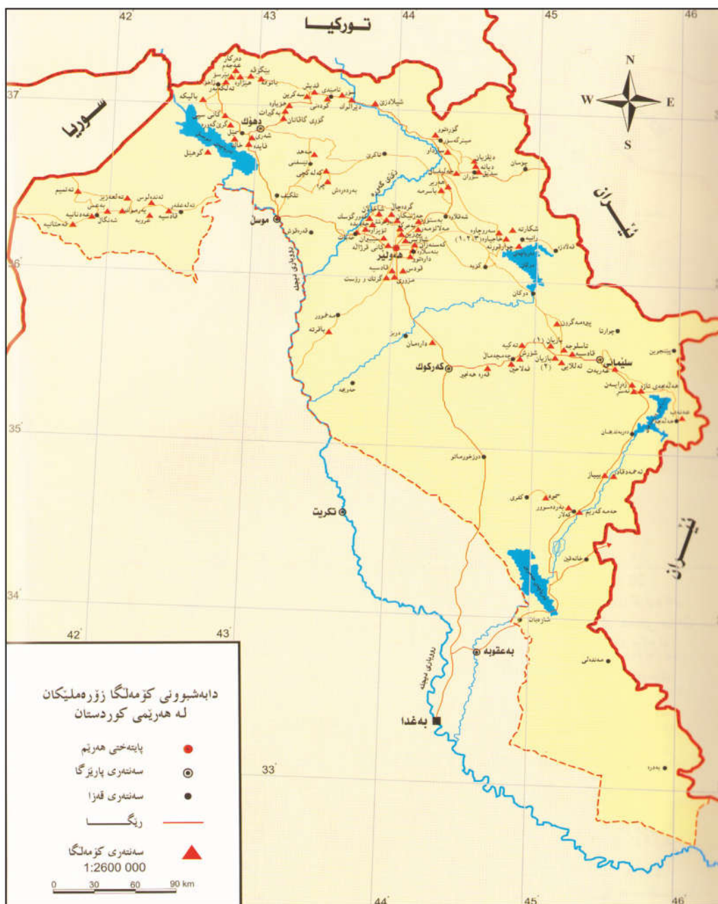
نەخشەی ژماره (٣) دابهشبوونی کۆمه‌لگا زۆره‌ملیکان له هەرێمی کوردستان*