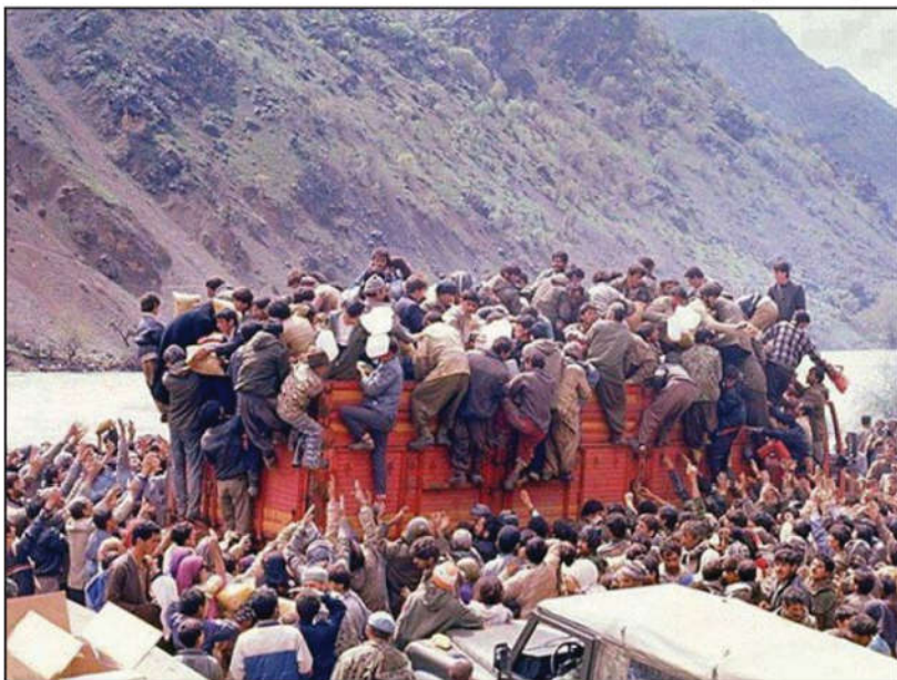
له کۆڕەوێ سالی ۱۹۹۱ دا

لەمیانەی بابەتەکانمان دەردەکەوێت کە ئەو رژێمانەیی کوردستانی بەسەر دابەشکراوە، هەمان سیاسەتی پاکتاوکردنی رەگەزیان دژ بە گەلی کورد پەیرەو کردووە. چەندین شیوازیان بەکارهێناوە بۆ سڕینەوێ نەتەوێ کورد، بۆیە بەردەوام لە دژایەتی کردنی کورد هاوکار و هاوڕا بوونە و پەیمان و بەلێنیان لەنیوان خۆیاندا بەستووە. هەریەک لەو ولاتانەیی ئەو بەشەیی کوردستانی بەرکەوتوو، بەهیچ جۆریک بە خاکی کوردی نازانی و دانیش بە مافەکانی گەلی کورد نانی.