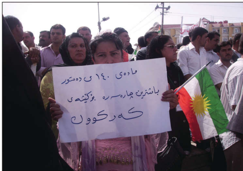
داواکاری ناوچه دابری نراوه کان به جیبه جیکردنی ماده ی ( ۱۴۰ ) ی دهستوری نویی عیراق

هه رچه نه له دواى روخانی رژیمی به عسه وه چاره نویسی ناوچه دابری نراوه کان به ستراوه ته وه به ماده ی ( ۱۴۰ ) ی دهستوری نویی عیراق، که به پیی ئه م ماده یه ده بوايه تا کو تایی سالی ( ۲۰۰۷ ) کیشی پاکتاوی ره گه زی له م ناوچانه دا چاره سهر بکرا بایه و چاره نویسیان دیار بکرا بایه، که ده چنه سهر سنووری حکومه تی هه رژیمی کوردستان یا له گه ل دهسه لاتی ناوه ند ده مینه وه، به لام تا کو ئیستا جیبه جینه کراوه و ئه وه به نه ده ده ستوریانه ش مسوگه ر نین له به رده م هیزه تونده وه عه ره بیه کاندای تا کو به رجه سته بییت.