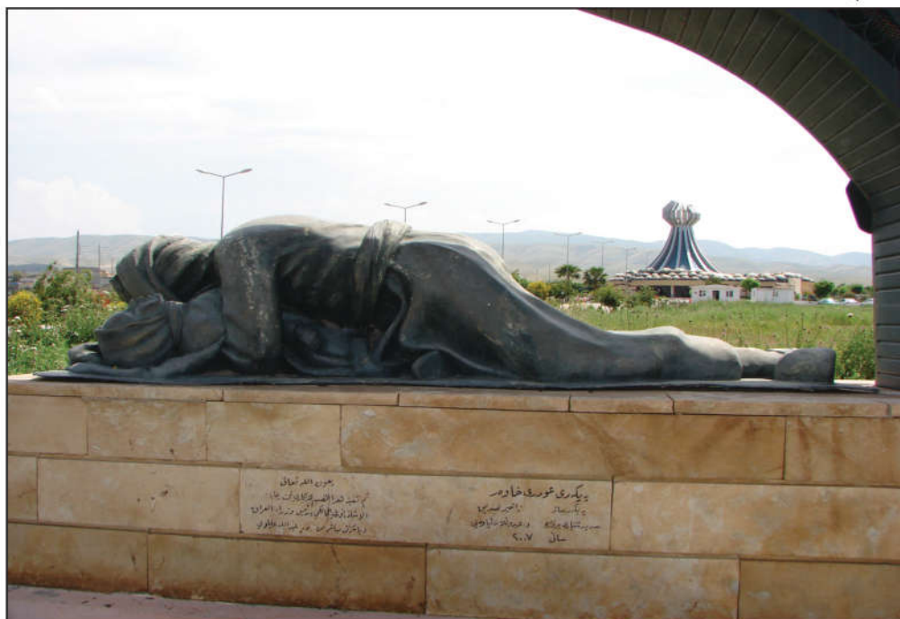
په‌یکه‌ری عومهری خاوه‌ر و مۆنۆمێنتی شه‌هیدانی هه‌له‌بجه

رۆژ بە رۆژ بە کاھینانی ئەم چەكە ترسناكه تا دەهات له زیادبوون دابوو، له قوناغه كانی ئەنفال گەيشته لوتكه ی بەكارهینان، رژیـم بهـبیـ سـلـهـمینهـوه هـهـر بهـرگریهـكهـك یا كۆسپێك له شوینێك بهاتابایه پیـش سوپای رژیـم بهـ چەکی کیمیایـی چارهـسەریان دەکرد. هۆیهـكهـشی بۆ بـیـدهـنگی كۆمهـلگهـی نـیـودهـولـهـتی و بـیـكهـسی گهـلی كوردو گۆشهـگیری له ناوچهـیهـکی دابـراـواـدا دهـگهـریتـهـوه .