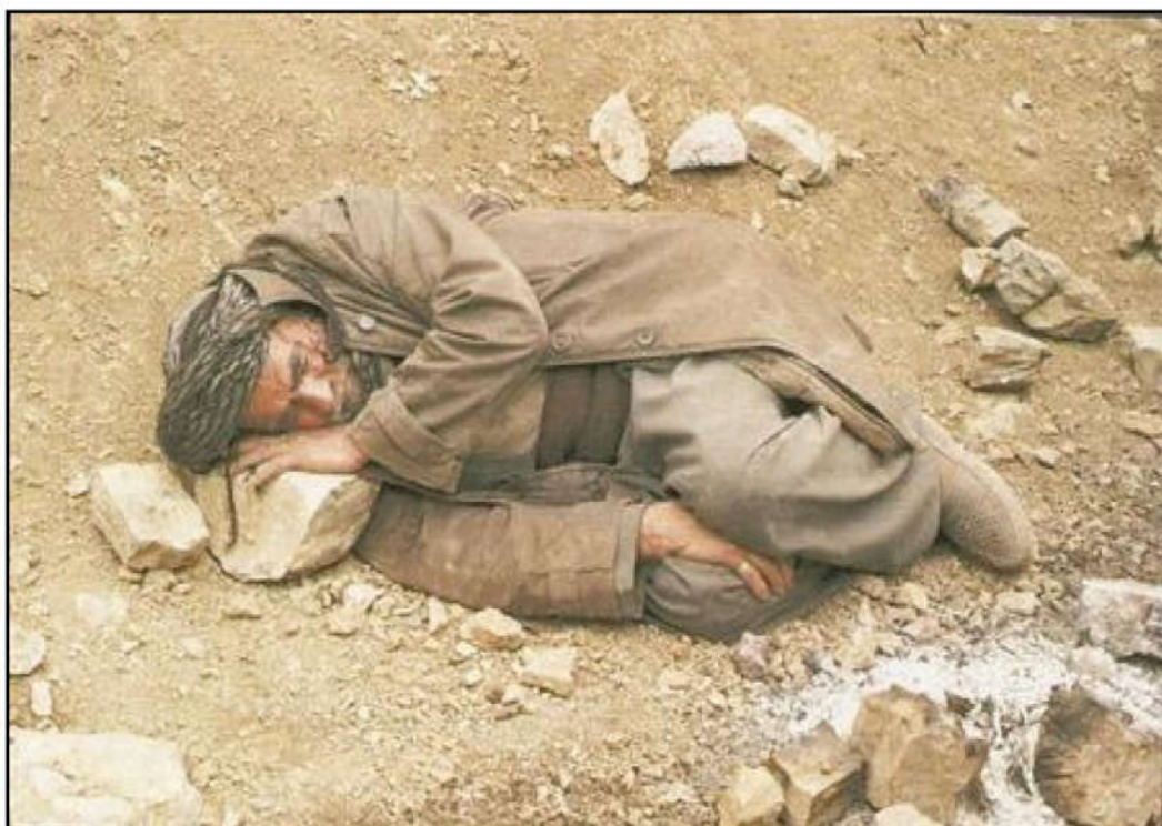
دادگای بالای تاوانه کانی عێراق کیشهی کورده فه یلییه کانی به جینۆساید ناساند

به لگه نامه ههیه که رهچه لهکی عێراقی خۆی بسه لمیڤنی، ده بی له سه ر ژمیڤری ۱۹۵۷ ناوئوس کراییت، به لام خه لکیکی ژۆر به لگه نامه کانیا ن نه ماوه، له بهر ئه وهی رژیم له کاتی شالۆه کانی ده رکردن و گرته کان هه مووی له ناو بردووه.