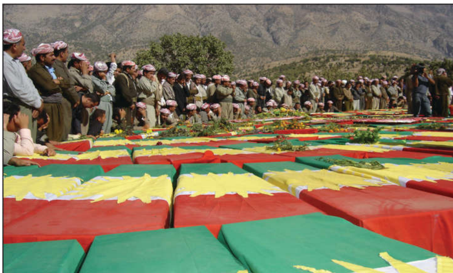
رپۆره سمی دووبار ناشتنه وهی زینده به چالکراوه کانی بارزانی له گوړستانی بارزان

له دواي روخانی رژیم له سالی ۲۰۰۳، له مانگی تشرینی یه که می ۲۰۰۵ به رپۆره سمیکی شایسته، ته رمی (۵۱۳) پینج سه د و سیزده که س، که له گوړه به کۆمه له کانی بیابانی بوسه یه زینده به چالکرا بوون، که رپێدرانه وه زیدی باب و باپیرانیان له نزیک بارزان دووباره به خاک سپێدرانه وه.