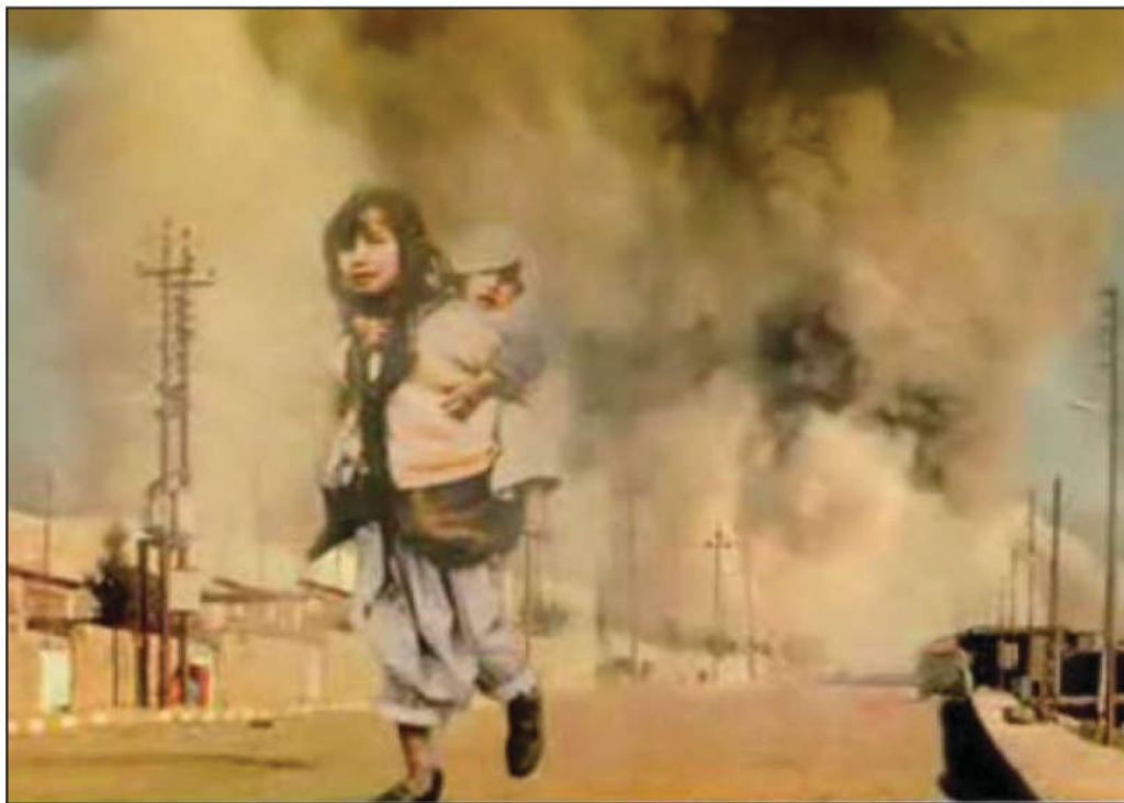
( ١٦ ئادارى ١٩٨٨ ) له كاتى بوردمان كردنى هه لـ بـجـه

رهوبكه ن، به لام فرۆكه كانى رژيم بهردهوام به سهر ناوچه كه دا دهسورانه وه و دهرفه تيان نه دا خه لكه كه خويان رزگار بكه ن.