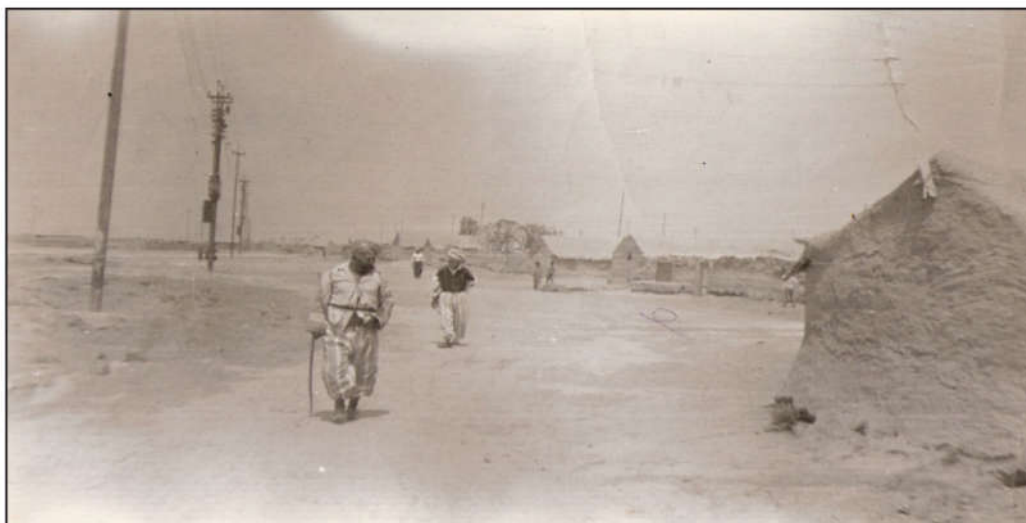
کۆمه‌لگه‌ی بارزانیه‌کان له قوشته‌په، دور له پێداویسته‌کانی ژیان

جێبه‌جێکردنی مه‌به‌سته‌کانیان، له به‌عه‌ره‌بکردن و تواندنه‌وه‌ی گه‌لی کورد، له قاوغی نه‌ته‌وه‌ی عه‌ره‌بیدا، بۆیه رۆژ به‌رۆژ هێرش و په‌لاماره‌کان توندتر ده‌بوونه‌وه و قوریانی زۆر ترو پێشیلکردنی مافه‌کانی مرو‌فیش زیاتر ده‌بوون. بارزانییه‌کان له م هێرشانه پشکی شیریان به‌رکه‌وتوه، چه‌ندین جار له زیدی باب و باپیرانیان راگو‌ی‌زاون و تالانکراون. هه‌ر له سه‌ره‌تای سییه‌کانی سه‌ده‌ی رابردوو که‌وتنه به‌ر په‌لاماری له‌شکری پیاده‌ی عێراق، به پالپشتی فرۆکه جه‌نگیه‌کانی ئینگلیز، چه‌ندین گوندیان وێرانکرد و دانیشتوانه‌که‌یان به‌ره‌و تورکیا رایانکردوه.