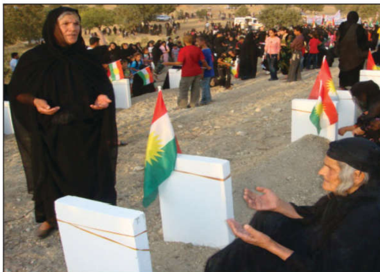
دایکان له سهر گۆری که سوکاریان، له دوا ی هیئانه وه یان له بیابانی بوسه یه ی موسه نا

له م په لامارانه ی گرتن و راوه دونان، نزیکه ی (۸۰۰۰) ههشت ههزار نږینه ی بارزانی له گهنج و پیر به ساغ و نه خوښه وه، ته نانه ت هوانه ی که له روی د هرونیشه وه ته واو نه بوون ده سگری کران و شونبز کران و ژن و منداله کانیشیان به بی سهرپه رشتی و به ژیانیک ی مه رگه ساتی له ئوردوگاگان هیشته وه. به پیی به لگه نامه کان، ئه و پیاوه بارزانیانه ی ته مه نیان له ۱۵ سال به ره و سهره وه بوو بو به غدا گواسترانه وه و رهوانه ی دادگای به ناو شوړش کران، له م دادگایه به شیوه یه کی ره مه کی حوکمی له سیداره دانیان به سهردا سه پانندن، دواتر حوکمه که جیبه جیگرا. هه رچه نده ئه و تۆمه تانه ی که ئاراسته ی ئه و که سانه کرابوو بیینه ماو نادروست بوون، به لام به دادگایه کی روکه شانه سزای مه رگیان به سهر سه پیندرا، هه ندیکیشیان پاش گرتنیان گواسترانه وه بوو خواروی عیراق، رهوانه ی پاریزگای موسه نا (سه ماوه) کران، له ئوردوگاگانی (ئه بوجد و ئه لیه) دا ده سبه سهرکران. ئه م شوینه (۴۵) کم له سنووری سعودیه دووره، ناوچه یه کی بیابانی لماوییه.