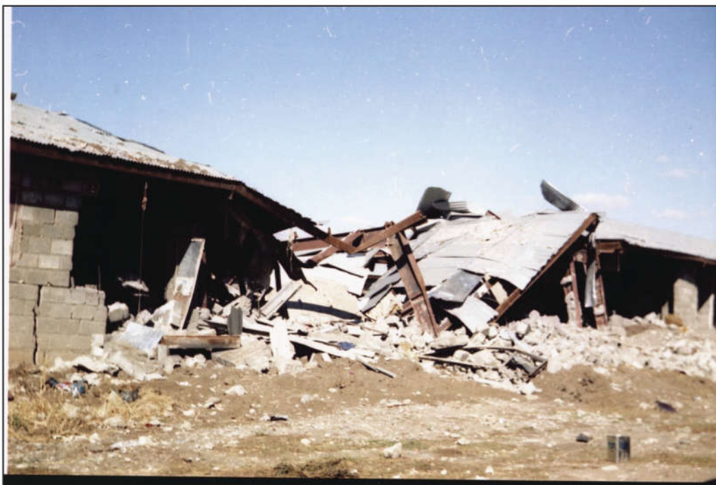
شوينەوارى بۆردومانى ئۆردوگای زيوە لەلايەن فرۆكە جەنگيەكانى عيراق

بەسرە) راگويزران، بۆچەند سالىك لەوئ مانەو، پاشان خىزانەكانيان بەسەر گوندەكانى دەوك و ھەولير دابەشكران. لەدواى ريكەوتننامەى جەزائير، كە لە نيوان شاي ئيران و حكومەتى عيراق لەسالى ۱۹۷۵ لە دژى بزوتنەوەى گەلى كورد مۆركرا، بوو ھۆى شكستپيھينانى بزوتنەوەكە. حكومەتى عيراق ئەم ھەلەى قۆستەو و كەوتە گيانى گەلى كورد بەگشتى، بارزانيەكانيش بەشيك بوون، كەوتنە بەر ئەم شالۆ ھەمراھەى. لەدواى سالى ۱۹۷۵ پروسەى راگواستن فراوانتر كرا، ھەندىكيان بەرھەو ئيران رۆيشتن و ھەندىكيشيان گەرانەو ھەمراھەى كوردستان.