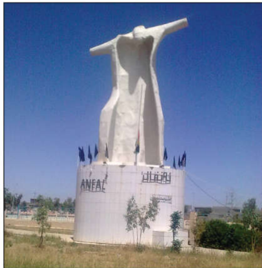
مۆنۆمێنتى ئەنفال لە گەرمیان

لە ئەنفالی قەرەداغ ئەو هاوولاتیە کوردانەى کە گیران یا خۆیان دا بەدەستەو، بۆ سەربازگەى قۆرەتوویان گواستەو، کە نزیکەى هەشت هەزار کەس دەبوون لە ژن و منداڵ و پیر و گەنج، پاشان گواستەو بۆ سەربازگەى تۆبزاوێ نزیك کەرکوک. ئینجا لەوێ گەنجەکانیان لەوانى تر جیاکردەو و بەرەو شوینی نادیار رەوانەکران، خەلکەکەى تر لە ژن و منداڵ و کچی عازەب خزانە زیندانەو بەلام پیرەژن و پیرەمێردەکان بۆ (نوگرەسەلمان) ی بیابانى سەماوێ گواستەو، کە لەوێ ژمارەیهکی یەكجار زۆریان لە برسان و تینویەتى و نەخۆشى مردن و تەرمەکانیان فرێدەدرایە دەرەوێ زیندانەکە، سەگ دەبخواردن.