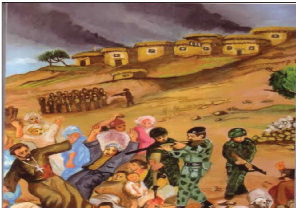
گوللەبارانکردنی (٦٠) کەس لە دانیشتوانی گوندی (صوریا)

لە ئەشکەوتییکی نزیک گوندە کە خۆیان حەشار دابوو. لە (١٦-٩-١٩٦٩) هێرش بۆ سەر گوندی (صوریا) لە سیڤگۆشەیی سنووری عێراق و تورکیا و سوریا، (٦٠) کەس لە دانیشتوانە سڤیلە کە ی گوللەباران کران. هەرچەندە مانگی ئاداری ١٩٧٠ رێکەوتننامەی ئادار لە نیوان بزوتنەوەی کورد و حکومەتی عێراق مۆرکرا، کە دانپێدان بوو بە مافی ئۆتۆنۆمی گەلی کورد لە هەریەک کوردستان. بەلام بەر لە راگەیاندنی یاسای ئۆتۆنۆمی ژمارە (٣) سالی ١٩٧٤، حکومەت دەستیکرد بە جێبەجێکردنی بە پەلەیی سیاسەتی بەعەرەبکردن و راگواستنی دانیشتوانی ناوچەکانی کەرکوک و خانەقین و زمار و شەنگال و شیخان. لە سالی (١٩٧١ - ١٩٧٢) زیاتر لە (٤٠٠٠) چل هەزار کوردی فەیلی ناسنامەی هاوولاتی بوونی عێراقییان