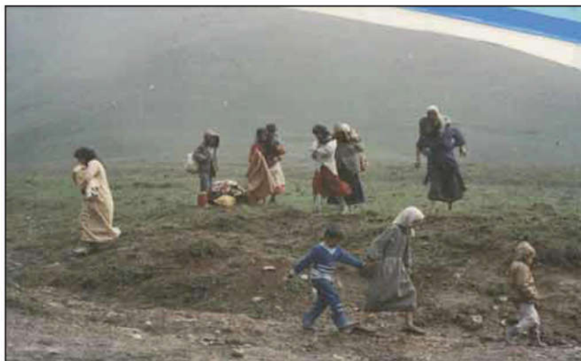
دەركردنى كورد لە زىدى باب و باپىرانىان

دواى ريكه و تننامهى جه زائىر سالى (١٩٧٥) و هه ره سهينانى شۆرشى ئه يلول، ده ستي حكومه تى عىراق كراوه بوو، بۆ جيبه جيكردى زياترى سياسه تى به عه ره بکردن و راگواستنى كورد، به لام ئه مجاره يان به پيى نه خشه يه كى پلان بۆ دارپژراو ئه نجامدرا، نه ك له و ناوچانه ي كه فره نه ته وه بوون، به لكو ئه مجاره يان ناوچه زۆرينه كورد ييه كانيشى گرت وه. به راگويزرانىان بۆ كۆمه لىك شوينى ديارىكراو، كه به عسيه كان ناويان نابوو (گوندى هاوچه رخ)، كه چى له راستيدا ئۆردوگاي زۆره مى بوون. بيجگه له م ژماره زۆره ي هاوولايانى كورد، كه بۆ ناوچه كانى باشوورى عىراق، به تايبه تى هه ردوو شارى (ناسريه و ديوانيه)، سالى (١٩٧٥) زياتر له (٢٠٠٠٠٠) دووسه ده زار كورد له كوردستان وه به ره و ناوچه كانى باشوورى عىراق راگويزران. له مانگى يازده ي ١٩٧٥ كۆمه له ي گه لانى هه ره شه ليكراو له ئه لمانيا - گويتنگن، له گه ل كۆمه له ي مافى مرۆڤ له هۆله ندا، رايانگه ياند ژماره ي راگويزراوان