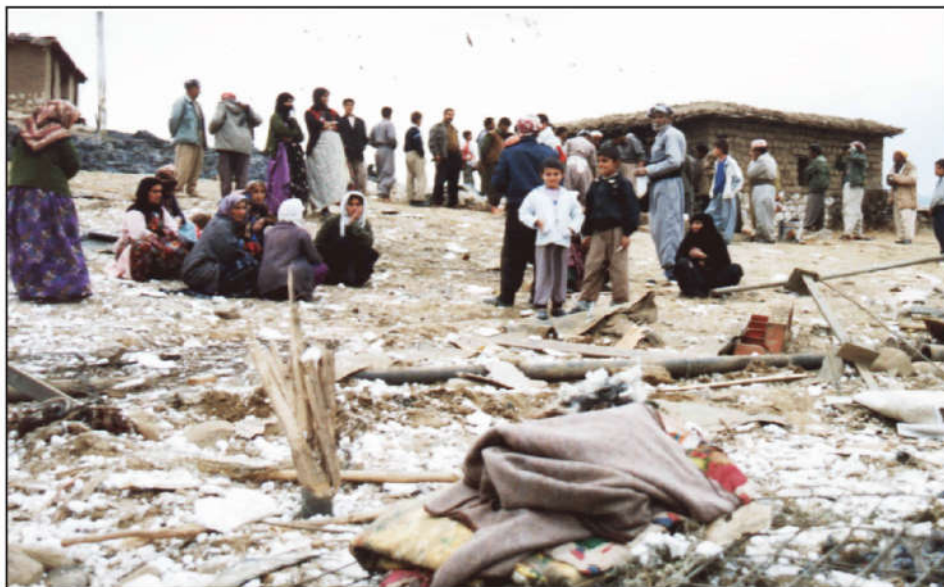
خۆ ئامادەکردن بۆ كۆچ لە دواى ئەنفال

سەرجه می گونده وێرانکراوهکانی شالۆی ئەنفالی کۆتایی بەپێی زانیارهکان (٤٥٠) چوار سەد و پەنجا گوند بوو. زیانه گیانیەکانی ئەنفالی بادینان بە نزیکەی سی و دوو هەزار کەس دەخەملینرێت، گولەباران و شونبزرکران، زیاتر لە سەد هەزار کەسیش ئاواره و دەربەدەری تورکیا و ئێران بوون، ئەوانی تریش گواستراوه و بۆ کۆمەلگاگانی جەژنیکان لە نزیک هەولێر.