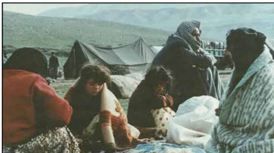
کوردە فەیلییه‌کان لە خێو ه‌تگاکانی سەر سنوری ئێران

لە سالێ ١٩٢٤ یاسای رەگەزنامە ی عێراقی جەختی لە سەر دابەشکردنی گەلی عێراق کردە وە بۆ سێ بەش لە سەر بنەمای ئایین و نەتە وە. کوردە فەیلییه‌کان لە بەر ئە وە ی لە پە یڕه‌وانی رێبازی شیعە مەزەه‌ب بوون، بە رەچە لێکی ئێرانی ناو نو سکران، بۆیه‌ بە بەردەوامی کەوتنە بەر هێرشێ دەسەلاتدارانی عێراق.