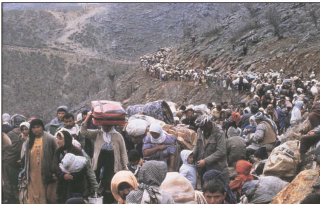
کۆرەوی کوردان لە ساڵی ١٩٩١

کار بکات، چونکه ئەم راپەرینه میژووییە هەموو ئەو ناوچانەشی گرتەو، که به‌عس دەیان سال بوو خەریکی سەرینه‌وەی مۆرکە نەتە‌وه‌ییە کوردییەکانی بوو.