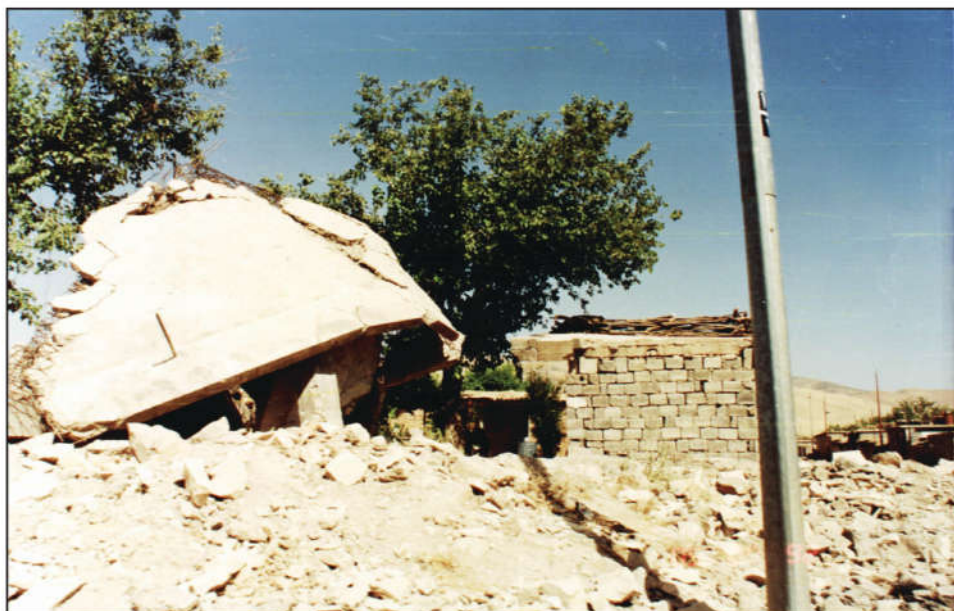
ویرانکردنی گوندهکانی کوردستان له کاتی ئەنفال

به لām گهراوهکانی باشووری گهرمیان له دوو مهلبهندی سه رهکی کۆکرانهوه، یه کێکیان مهلبهندی لاوانی دوزخورماتو بوو، که نزیکه ی چوار ههزار کهسی تێدا بهندکراوو، سهربازهکانیش زۆر نامرۆقانه ههلسوکهوتیان له گهڵ دهکردن، سه رهپای ئەشکهنجهدان و برسیکردن و تینوکردن، هه رچی پاره و زیڕو شتی به نرخیان پێبوو له ئافرهتهکانیان دهستاند، پێیان دهوتن ئێوه یارمهتی (موخه پێتان) داوه (پیشمه رگه). به لām مهلبهندی دووهم بۆ کۆکردنه وه ی گهراوهکان، باره گای فیرقه ی (٢١) بوو له قۆره توو. له زاری یه کێک له ده ربازبووه کانه وه هاتوو، که نزیکه ی ده ههزار کهس له م قه لا سه ربازییه بهندکراوون.