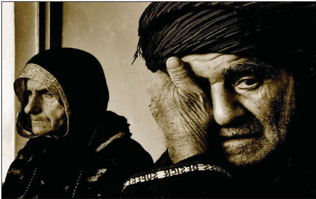
رزگاربووانی کیمیابارانی هه‌له‌بجه

به ته‌واوه‌تی و کوشتنی هه‌رچی په‌له‌وه‌ر و مالاتی ناوچه‌که بوو هه‌مووی قێکرد.