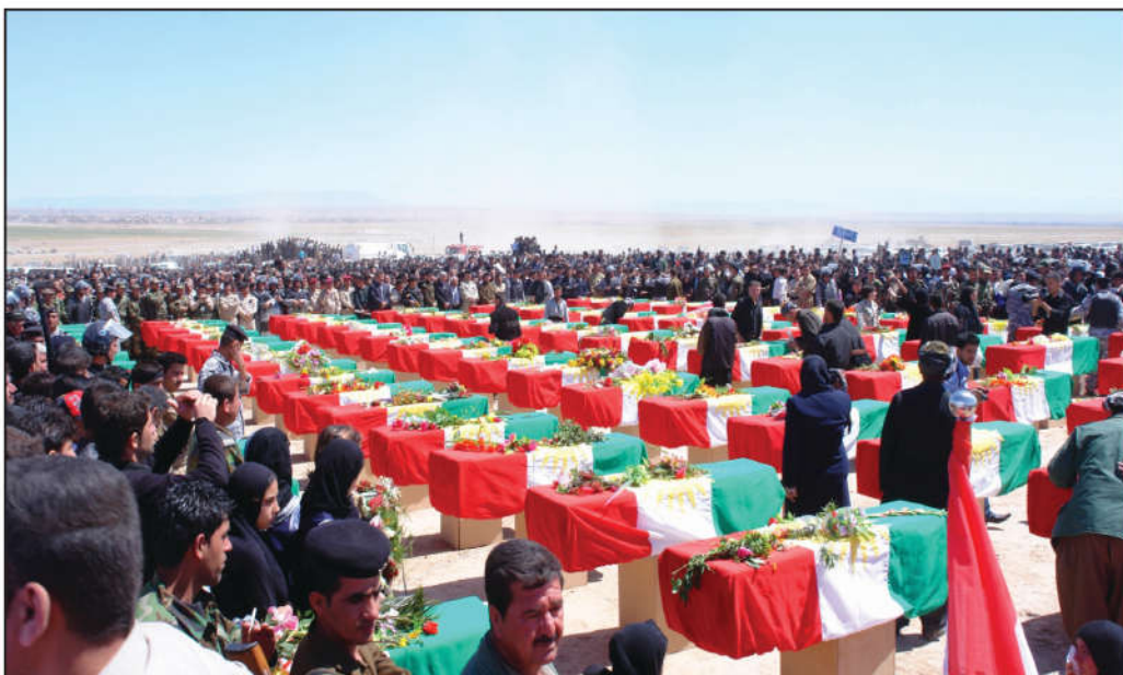
رێپەرەسمی دووبارە ناشتنەوێ ئەنفالکراوانی گەرمیان

ئەنفال بەرچاوترین تاوانە لە دواى شەپى دووھەمى جیھانیەو بە سەرگەلى کورد داھاتوو، بۆ لەناوبردن و سەرکوێکردنى بزوتنەوێ نەتەوێ کورد و سڤینەوێ ھەموو مۆرکێکى نەتەوێ و کولتورى و مێژووی و دیمۆگرافى و کۆمەلایەتى و ئابوورى...ھتد.